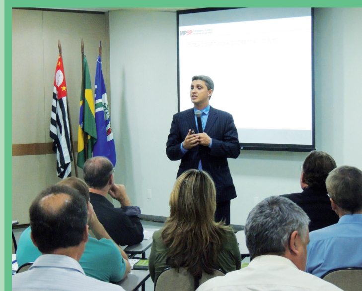
A palestra "Princípios norteadores do direito do fornecedor" conquistou a atenção e a aprovação dos empresários