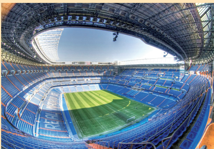
Para os amantes do esporte, uma visita ao Santiago Bernabéu, estádio do Real Madrid, é imperdível

Em Madrid, o clima é mediterrâneo e temperado, sendo que no inverno faz muito frio e o tempo é úmido, com queda acentuada de temperatura durante a noite, podendo ficar abaixo de zero grau, com geadas frequentes, mas raras quedas de neve. O período de chuva ocorre entre os meses de março e maio e de outubro a dezembro. No verão, o tempo é seco e as temperaturas são extremamente altas. A média anual em Madri varia entre 19°C e 25°C, sendo que em julho a temperatura média varia entre 32°C e 35°C.