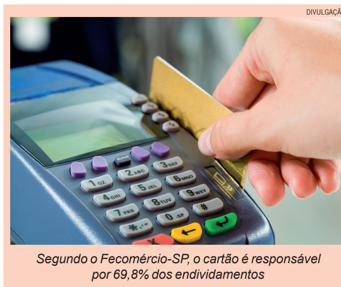
Segundo o Fecomércio-SP, o cartão é responsável por 69,8% dos endividamentos

Em casos em que a pessoa já entrou no crédito rotativo, o caminho é a negociação da dívida com a operadora do cartão de crédito, o que pode ser feito sozinho ou com ajuda. O Programa de Apoio ao Superendividado do Procon-SP, além de dar palestras gratuitas e informações sobre o tema, faz a ponte entre o devedor e o credor, sendo ele o banco, a operadora do cartão ou outra empresa.