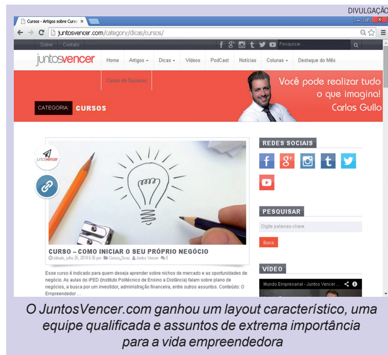
O JuntosVencer.com ganhou um layout característico, uma equipe qualificada e assuntos de extrema importância para a vida empreendedora