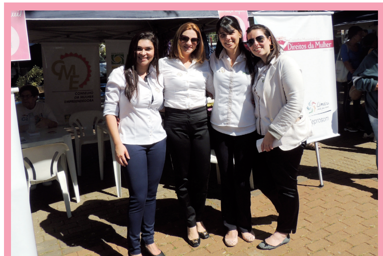
O CME da ACIL montou o estande “Doa-se Abraços” e distribuiu abraços para o público feminino presente no evento