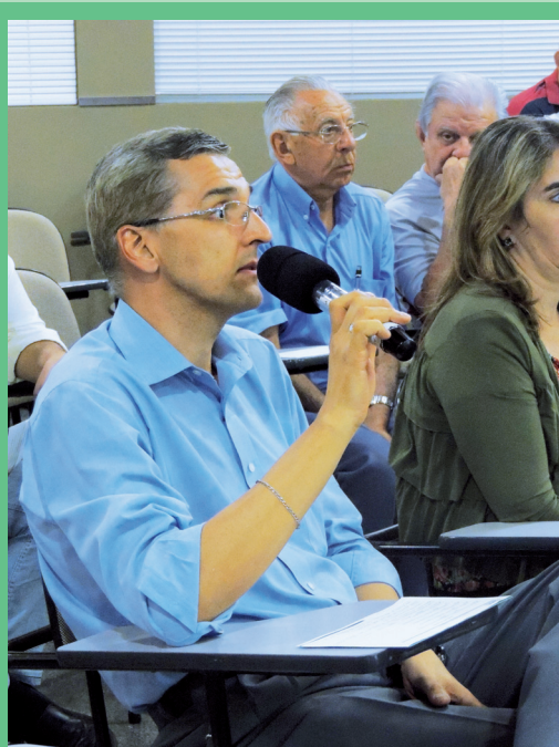
Após a palestra, os presentes puderam tirar dúvidas sobre o assunto abordado durante o encontro

3404-4903, ou e-mail: empreender@acil.org.br e prestigie esse evento que a cada edição supera as expectativas de todos aqueles que o prestigiam. Vale ressaltar que todas as palestras apresentadas nos encontros estão disponíveis no canal da ACIL no Youtube: ACIL Limeira. Confira!